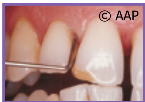
PERIODONTITIS DE MODERADA A AVANZADA